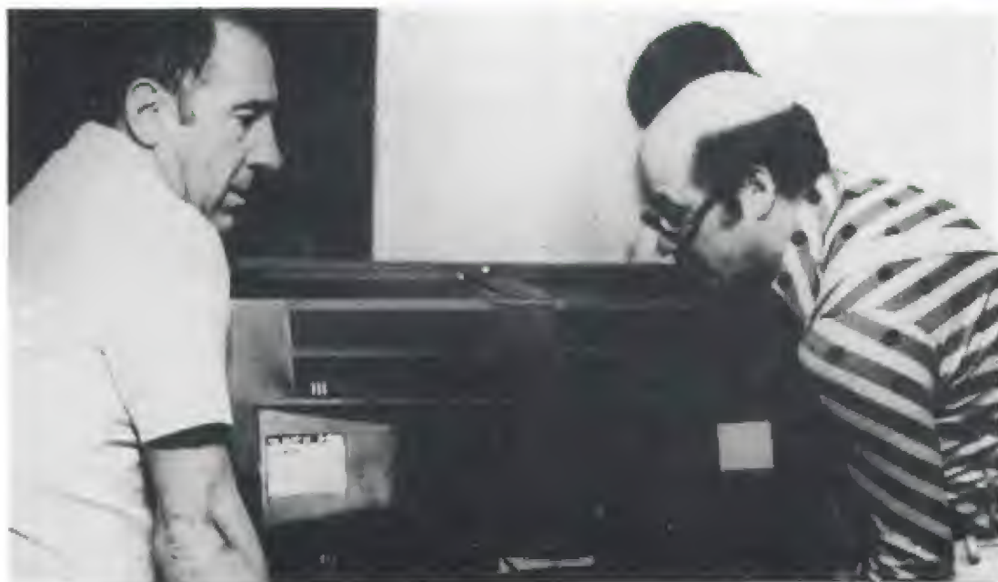
Alfredo Landa - Agustín González